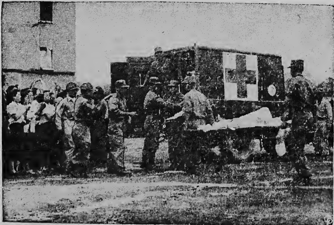
VROUWEN EN KINDEREN juichen een bevrijde soldaat die zojuist per stretcher de communistische gevangenschap verliet, hartelijk toe. De gewonde werd per heli-copter van Pan Mun Jon naar Seonl gebracht. Door de „copters” werd een luchtbrug geslagen, waardoor gewonde en zieke gevangenen zonder enig oponthoud naar de ziekenhuizen kunnen worden overgebracht.